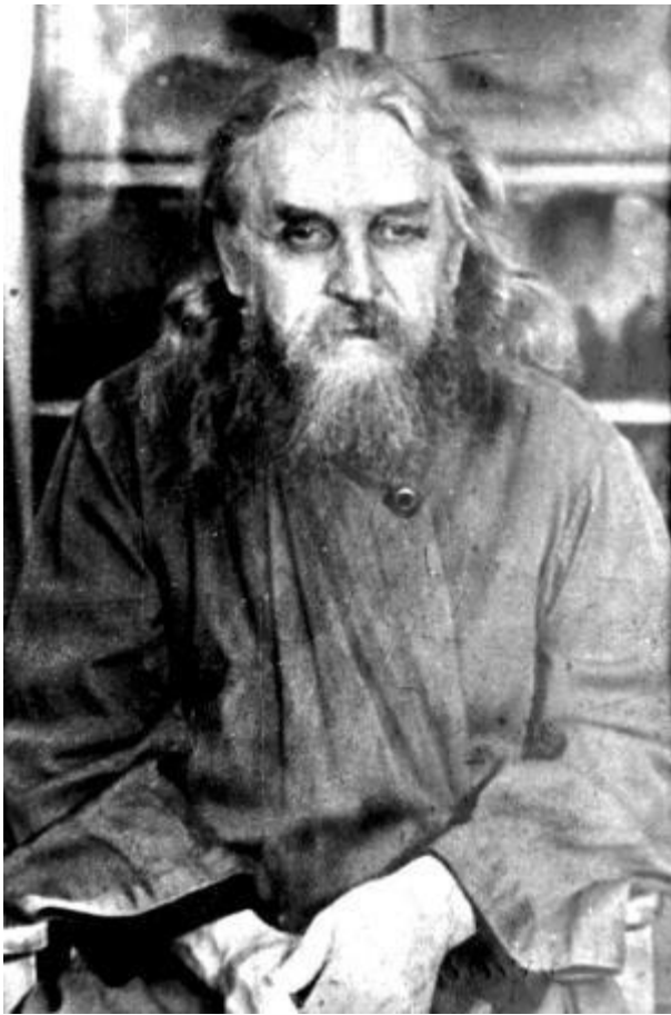
Отец Серафим (Батюгов). 1940-е

Особенно тепло вспоминал Сергей Фудель о своем многолетнем духовнике отце Серафиме (Батюгове): «Вот он стоит в подряснике, опоясанный кожаным поясом, в полумантии, — со всеми нами на молитве. Иногда крестит кого-то в пространстве перед собой — какого-то отсутствующего своего духовного ребенка. Иногда останавливает чтеца и начинает читать сам, но на середине псалма или молитвы вдруг замолкает, так глубоко вздыхая, что дыхание наполняет комнату. И мы молчим и ждем, зная, что его молитва именно сейчас не молчит, но кричит Богу. Или бывает так: он начинает читать молитву обычным голосом, размеренно, «уставно», но вдруг голос срывается, делается напряженным, глаза наполняются слезами, и так продолжается иногда несколько минут. ...Колея уставного молитвенного строя при нем иногда явно нарушалась. С ним могло быть, так сказать, неудобно молиться, так же "неудобно", как не умеющим плавать идти за умеющим в глубокую воду... Думаю, что еще в большем неудобстве мы бы почувствовали себя на апостольском богослужении, когда простые миряне получали откровения, говорили на незнакомых языках и пророчествовали» («У стен Церкви»).