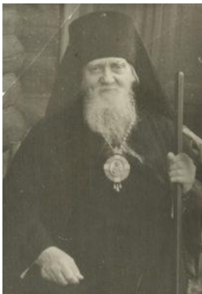
Святитель Афанасий (Сахаров), епископ Ковровский

километр» и наезжать в столицу эпизодически — чтобы поработать в библиотеках.