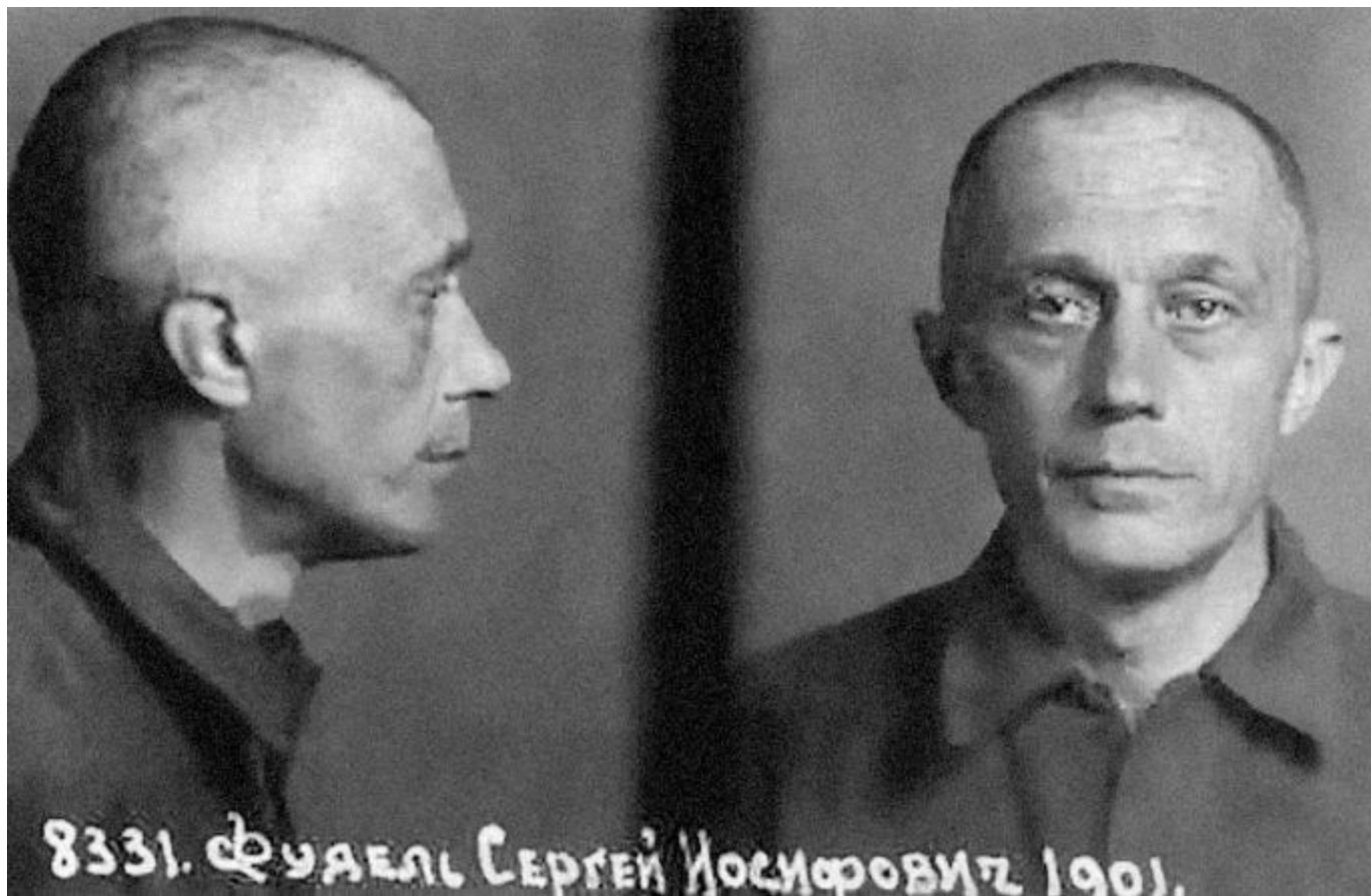
Фотографии из следственного дела в 1946 году

В 1933 году новый арест. За «недонесение о контрреволюционной деятельности» дальней родственницы. И новая ссылка — на лесоповал в Архангельскую область.